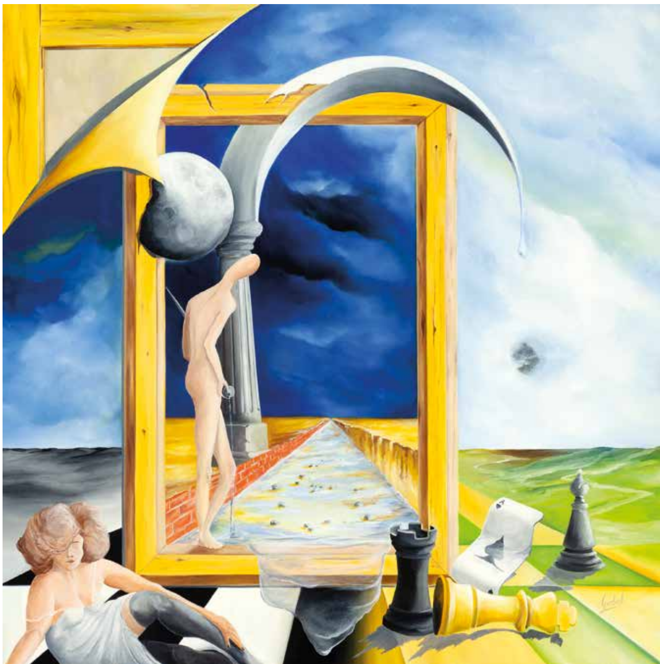
VISÕES DE UMA JOGADA NO MILÊNIO óleo sobre tela, 80x80 cm, outubro 2009