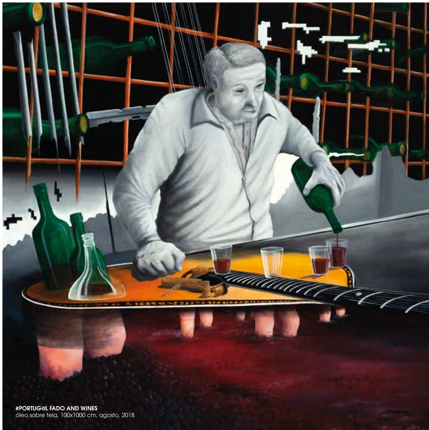
#PORTUG@L FADO AND WINES óleo sobre tela, 100x1000 cm, agosto, 2018