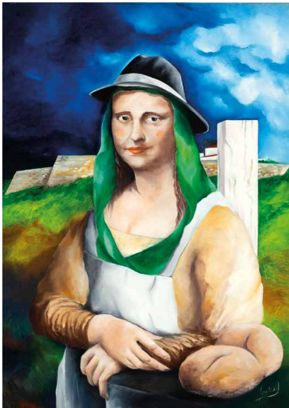
◀ THE WINE AND PORTUGUESE DISCOVERS óleo sobre tela, 90x70 cm, outubro, 2016